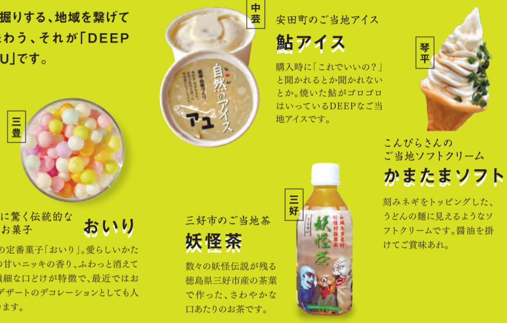
一般社団法人 三好市観光協会 琴平町観光協会 一般社団法人 三豊市観光交流局 中芸のゆずと森林鉄道 日本遺産協議会