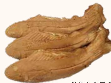
鮎焼き 1個 86円

【営業時間】11:00～15:00 【定休日】木・金・第1日 【連絡先】☎ 0883-78-3133