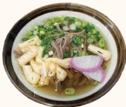
そば (祖谷そば) 350円