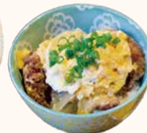
十割そば (祖谷そば) + ミニカツ丼 1,000円