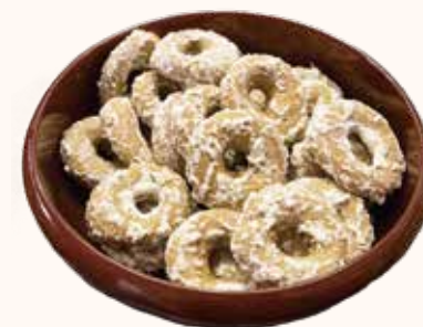
阿波の麦菓子 黒麦 1袋 430円

【営業時間】7:00～18:00 【定休日】1/1 【連絡先】☎ 0883-78-2046