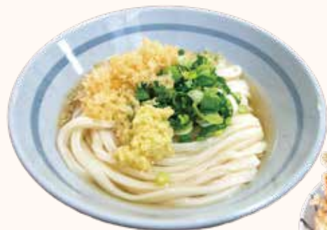
かけうどん小 280円 天ぷら1個 100円～