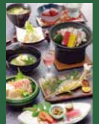
※季節により素材は異なります。

●最少催行人員1名 ●添乗員は同行致しません。 ●食料・昼食代が含まれます。 ※当商品は新日本ツアーリスト(香川県知事登録旅行業2-149)が企画・実施する募集型企画旅行です。詳しい旅行条件書をご用意致しておりますので予めご確認をお願い致します。