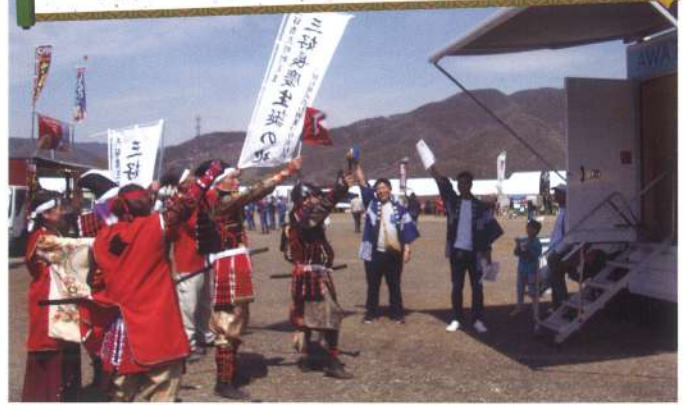
トヨタラリー参陣勝どき