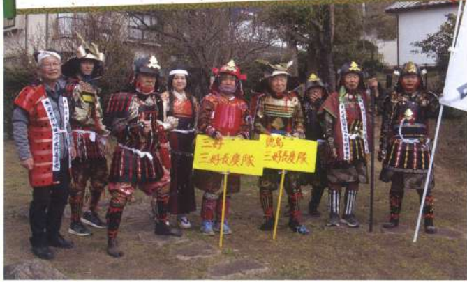
大東市武者行列参陣