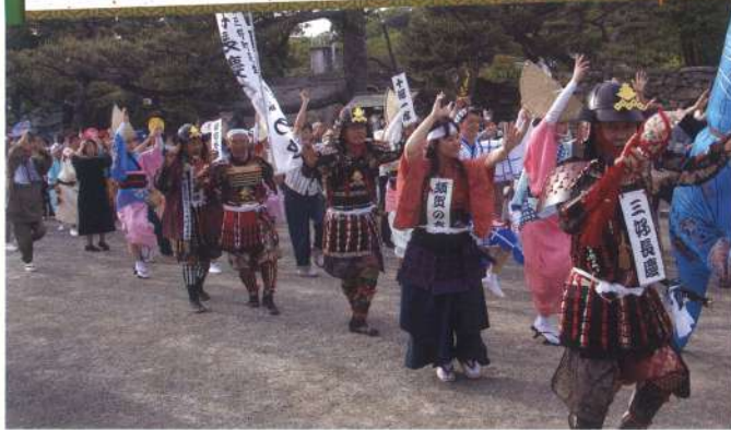
徳島時代行列まつり参陣「阿波踊り」